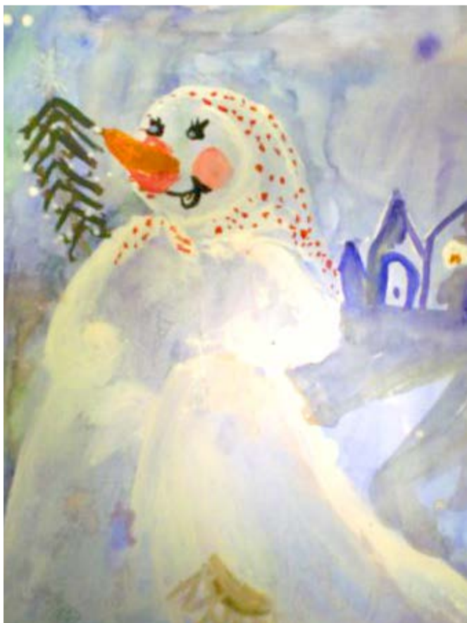
Яна Сушко, 8 лет